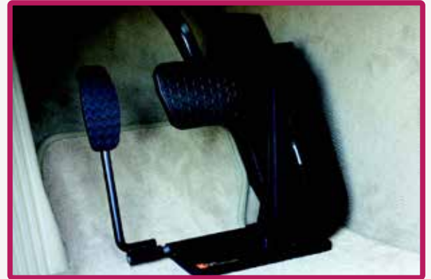
Inversion de pédale au plancher, se démonte rapidement